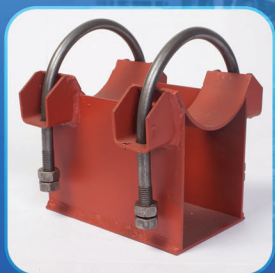
Опоры, подвески трубопроводов